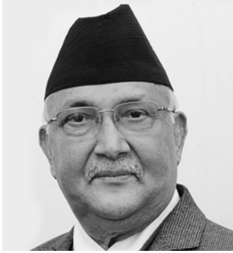
केपी शर्मा ओली*

आज देश एउटा अष्टचारो परिस्थितिसँग जुधिरहेको बेला, अष्टचारो परिस्थितिलाई सहज परिस्थितिमा रूपान्तरण गर्नका निम्ति तपाईंहरू असाधारण उत्साहका साथ यहाँ भेला हुनुभएको छ। यसबाट के स्पष्ट हुन्छ भन्ने अब नेपालमा कसैले अल्मल्याएर कोही अल्मलिँदैन। बरु देश भ्रमबाट मुक्त भएर अगाडि बढ्छ, भन्ने कुराको एउटा बलियो संकेत हो। यो कुरा तपाईंहरूको संकल्पबाट प्रकट भएको छ। देश अष्टचारो स्थितिमा छ। केही समयदेखि अष्टचाराहरू हामीले सामना गरिरहेका छौं। तर, यसका पछाडि के छ, भन्ने कुरा म अलिकति राख्न चाहन्छु।